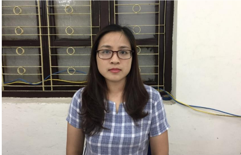
Hình 1: Hình ảnh webcam trên máy tính/điện thoại (nhìn thẳng).